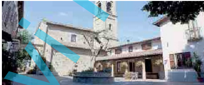
MARORE Uno scorcio della sede della Comunità di Betania.

mo aiutare gli insegnanti a dotarsi di strumenti concreti per gestire autonomamente alcuni nodi cruciali nei percorsi di crescita di bambini e ragazzi, da cui non si può più prescindere per una prevenzione mirata e per fare questo abbiamo preso in considerazione progetti "evidence based". Si è svolto il primo di tre incontri di formazione in modalità webinar, incentrati su vulnerabilità, resilienza, dipendenza, a cui seguirà la fase operativa. Gli insegnanti saranno chiamati a mettere in campo nuove pratiche di screening e prevenzione nei confronti degli allievi, pro-