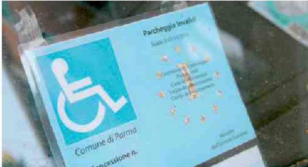
CAMPAGNA RIUSCITA L'iniziativa per la restituzione dei permessi sta dando buoni frutti.

portato a verificare l'esistenza dei circa 900 permessi "abusivi", non nasconde la propria soddisfazione: «Questi numeri vanno anche oltre le nostre aspettative. E sono la testimonianza che è stato corretto puntare a una campagna di sensibilizzazione delle persone sul tema dell'obbligatorietà della restituzione del permesso per disabili una volta che sono cessate, per morte del titolare o per altri motivi, le condizioni per esserne in possesso. Infomobility ha dedicato uno sportello apposito proprio per rispondere a questa esigenza e va detto che, oltre a quelli già restituiti, sono molte anche le richieste di chiarimenti che sono arrivate e il flusso delle restituzioni è continuato anche nei giorni successivi». L'assessore sottolinea che «è evidente che in molti casi c'è stata buona fede da parte dei cittadini, forse anche perché in molti sono, o erano, convinti che la restituzione