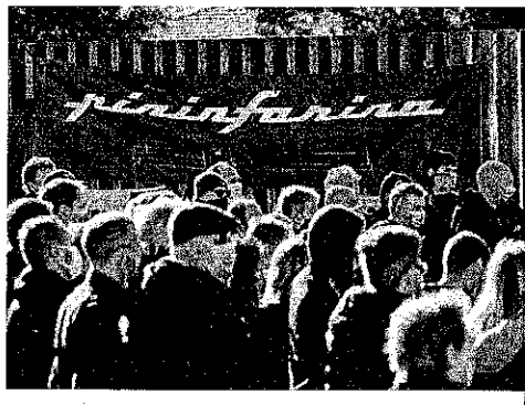
Il vescovo benedice un albero di melograno all'avvio del Festival della dottrina sociale

prime scuole per operai. «L'albero è segno di vita e di pace. Siamo vicini a Natale e tra i simboli della festa c'è l'albero addobbato di luci colorate per inneggiare alla nascita del Figlio di Dio luce del mondo. Così noi oggi vogliamo benedire questo albero di melograno che richiama la fecondità e abbondanza della generazione e lo facciamo proprio perché stiamo attraversando un momento difficile e meglio per la vita di tante persone a causa del coronavirus».